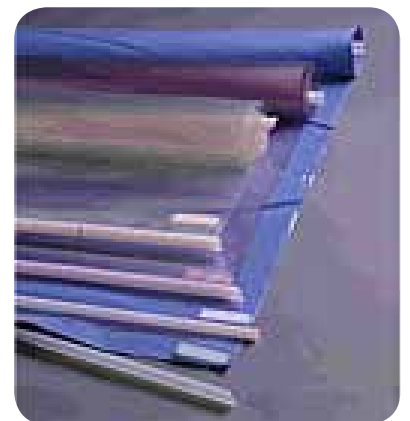
Vakuumpåsarna kan beställas i polyuretan eller vinyl i storlekarna:

124 x 124 cm 155 x 307 cm 124 x 246 cm 155 x 368 cm 124 x 307 cm 124 x 368 cm