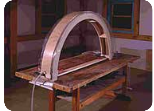
Vakuumpress i arbete med arbetsstycke inuti påsen och form under påsen