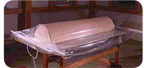
Vakuumpress i arbete med arbetsstycke och form inuti påsen

ERNST P. AB - www.ernstp.se - info@ernstp.se - Tel: 031-703 07 70